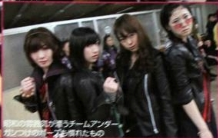
昭和の雰囲気を感じるチームアンダーガングの制服を着たもの