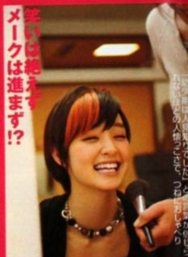
「スタミナつけようかな」と、8時から23時までの長丁場に備え、モリモリ食事。元気!