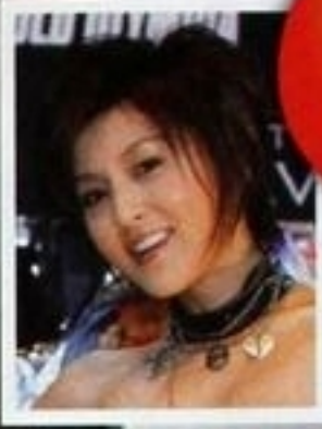
第1位 9票 藤原紀香さん

お尻の好みから楽しみ方、そして日ごろの妄想まで...お尻問題の国民意識をガチンコアンケート。多種多様な意見の集約がこちらのランキングだ!