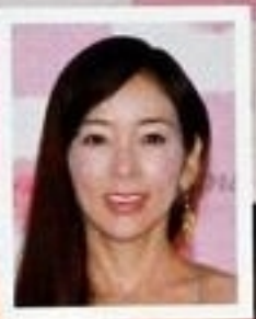
第5位 3票 川島なお美さん