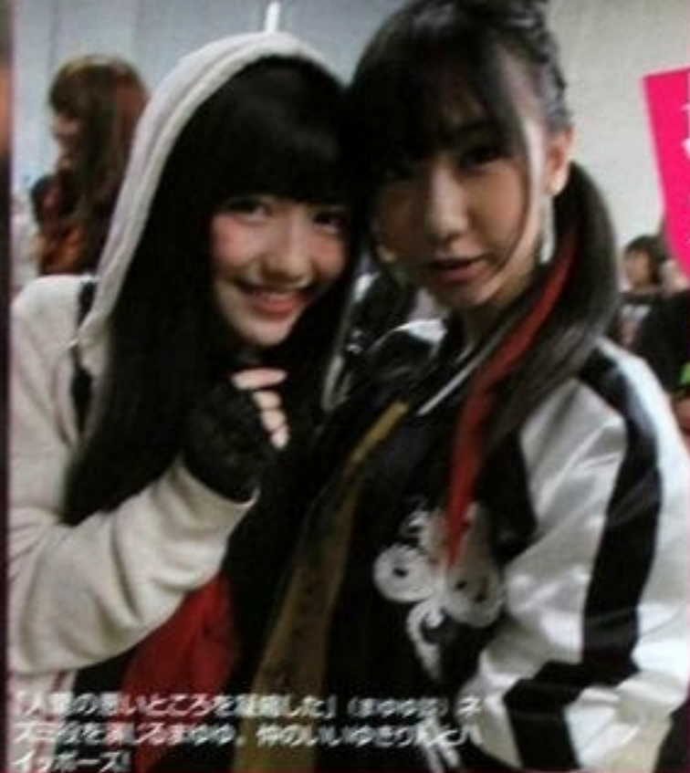
「人目の悪いところを隠した」(まゆゆ)ネズミ役を演じるまゆゆ、仲のいいゆきりんとハッピーポーズ!