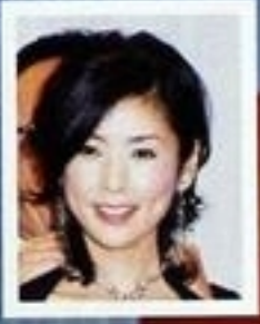
第3位 3票 黒木瞳さん

「引き締まったお尻が魅力的」(30歳/金融)と、特技のダンスで見事にキープされた微熱尻に熱視線。