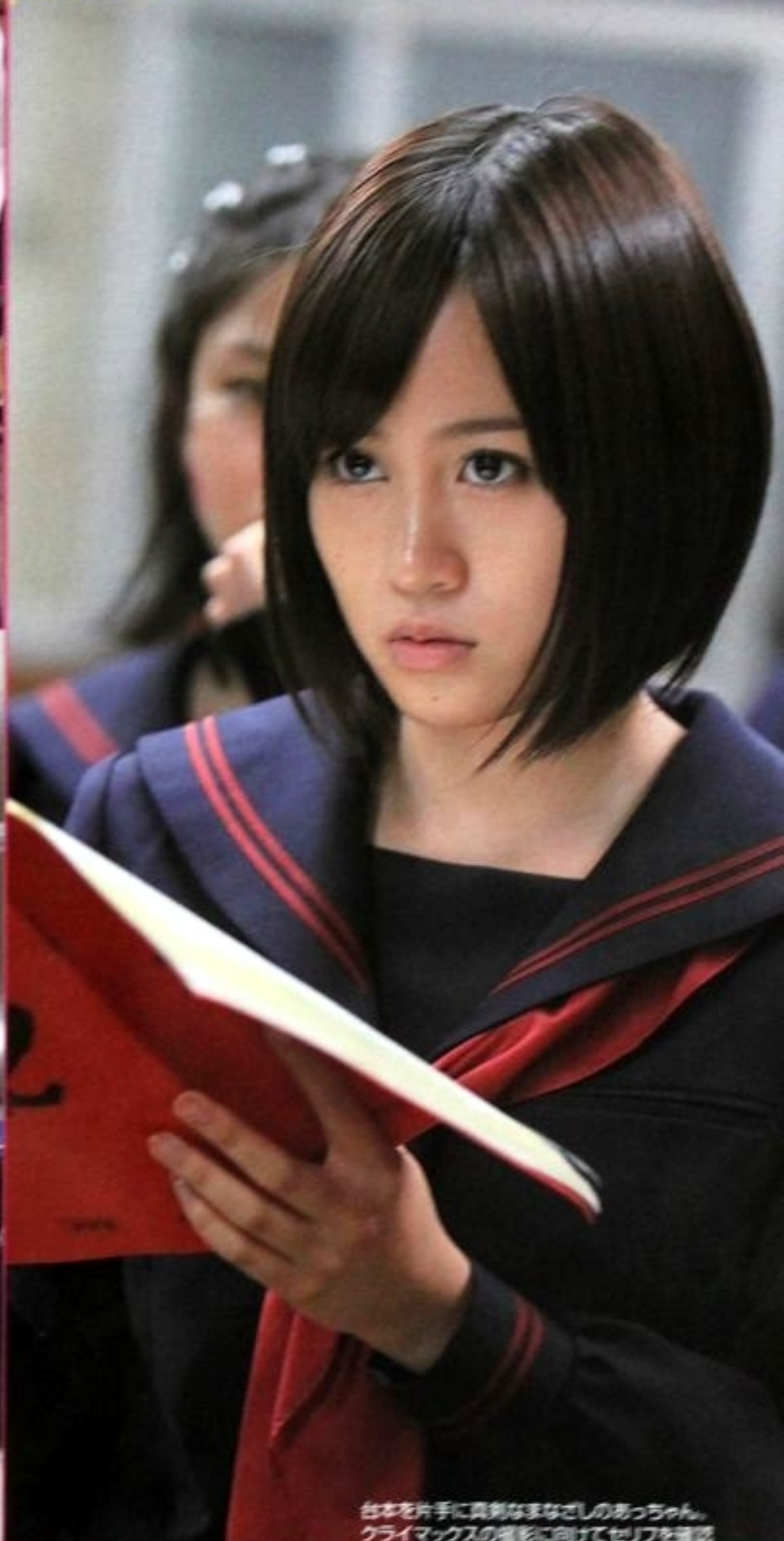
台本を片手に真剣なまなざしのあつちゃん。クライマックスの撮影に向けてセリフを確認